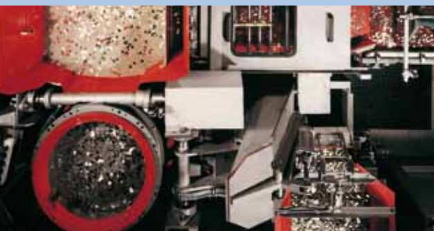
Die Komponenten sind vielfach erprobt und immer ist die Lösung hundertprozentig auf die kundenspezifischen Anforderungen abgestimmt

U nser Kunden sind so unterschiedlich wie ihre Produkte. Eine Herausforderung, der wir uns stellen. Gefragt sind maßgeschneiderte Konzeptionen. Maschinen und Verfahren, die perfekt auf die zu bearbeitenden Werkstücke zugeschnitten sind. Konzeptionen, die eine bedarfsgerechte Vor- und Nachbehandlung zulassen und zugleich Kosten sparen.