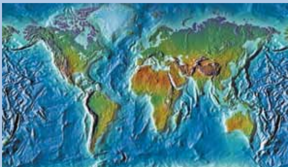
Zahlreiche Vertretungen sorgen weltweit für Kundennähe

Tradition und Innovation sind für uns keine Gegensätze: Wir kombinieren die Erfahrungen der Vergangenheit mit den Anforderungen der Zukunft, um Entwicklungen vorausschauend voranzutreiben. So erschließen wir unseren Kunden die überzeugenden Vorteile innovativer Oberflächenbearbeitung.